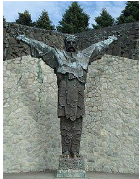
A Augustinčić : Spomenik Seljačkoj buni

Ambroz Matija Gubec bio je hrvatski seljak i vođa Seljačke bune u Hrvatskoj i Sloveniji u 16.st. Prije bune, Gubec je bio kmet na susedgradsko-stubičkom imanju omraženog vlastelina Franje Tahyja. U kratkom vremenu bune Gubec se pokazao kao sposoban organizator i nadahnjujući vođa, pa je odmah nakon smrti ušao u legendu.